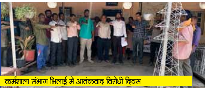
कर्मशाला संभाग भिलाई में आतंकवाद विरोधी दिवस