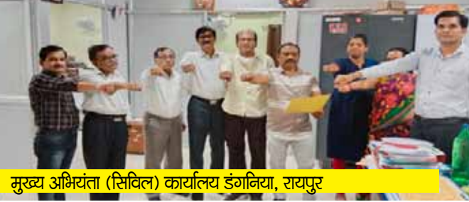
मुख्य अभियंता (सिविल) कार्यालय डंगनिया, रायपुर