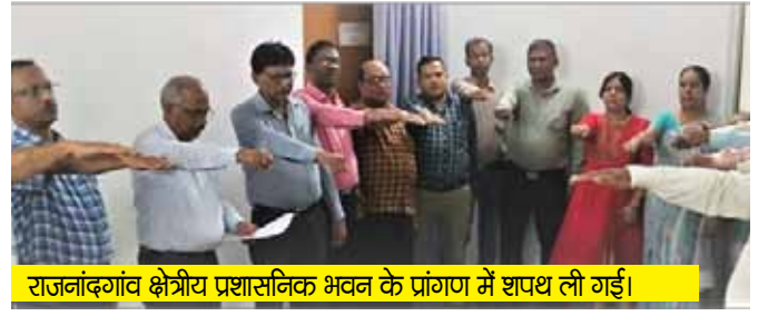
राजनांदगांव क्षेत्रीय प्रशासनिक भवन के प्रांगण में शपथ ली गई।