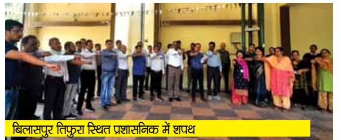
बिलासपुर तिफुरा स्थित प्रशासनिक में शपथ